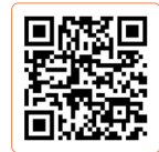
정답 및 해설