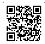
정답 및 해설